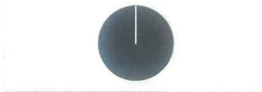
Grafički prikaz: Vlasnička struktura